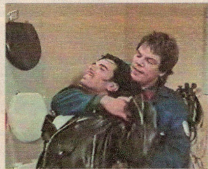
▲ ...Marienhof, vice-campeã de audiência na Alemanha